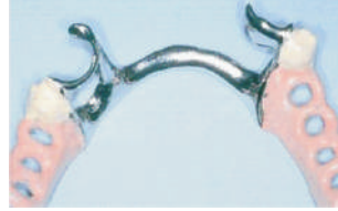
Prótesis combinada con Basic Paste y opaquer rosa y A3 Prosthesis with bonding and pink and A3 opaquer Kombimodellguss mit Verbund und zahnfarbenen und rosa Opaker