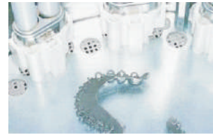
Fotopolimerización del Basic Paste Curing of the basic paste Lichthärtung der Basic Paste