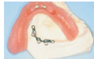
Prótesis con refuerzo metálico de resultado más estético Prosthesis with metal reinforcement esthetically upgraded Prothese mit Metallverstärkung ästhetisch aufgewertet