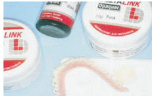
Aplicación del opaquer (rosa/A3/blanco) Application of the opaquer (pink/A3/white) Opakerauftrag (rosa/A3/weiß)