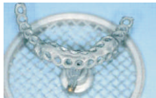
Estructura sobre implantes chorreada y con Basic Paste Sandblasted implant supported structure with basic paste applied Sandgestrahlte, implantatgetragene Metallstruktur mit aufgetragener Basic Paste