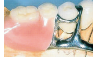
Prótesis de larga duración con una transición metal-resina limpia Finished denture with durable and definite metal-resin partitioning Fertige Prothese mit dauerhaften, sauberen Metall-Kunststoff-Übergängen