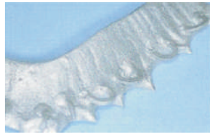
Chorreado del metal con Al 2 O 3 Sandblasting of the metal Das Metall wird sandgestrahlt