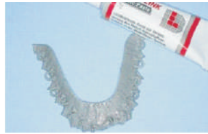
Aplicación del Basic Paste Application of the basic paste Auftrag der Basic Paste