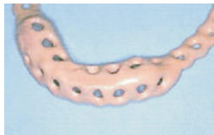
Superficie homogénea del opaquer polimerizado Cured homogeneous surface of the opaquer Ausgehärtete homogene Opakeroberfläche