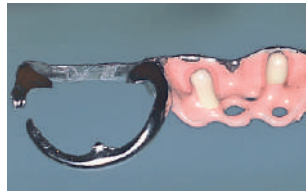
Esquelético con Basic Paste y opaquer rosa y A3 Framework with bonding and pink and A3 opaquer Klammerprothese mit Verbund und zahnfarbenen und rosa Opaker