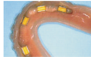
La prótesis terminada bajo el punto de vista estético e higiénico The finished denture in its esthetic and hygienic aspects Fertige Prothese unter ästhetischen und hygienischen Aspekten