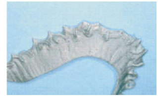
El resultado: duro y mate Mat cured bonding Matter, ausgehärteter Verbund