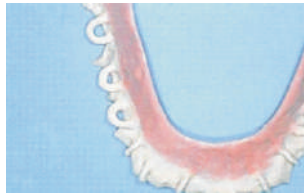
Opaquero fotopolimerizado Light-cured opaquer Lichtgehärteter Opaker